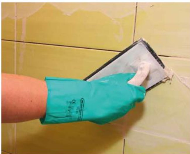
9 Затирка настенных керамических плиток раствором Sopro DF 10®.