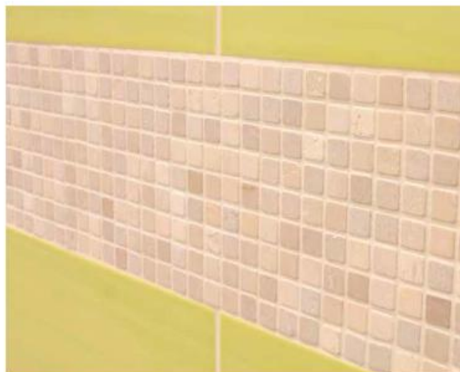
10 Поверхности, облицованные керамической плиткой и каменной мозаикой и затёртые Flex Sopro DF 10®.