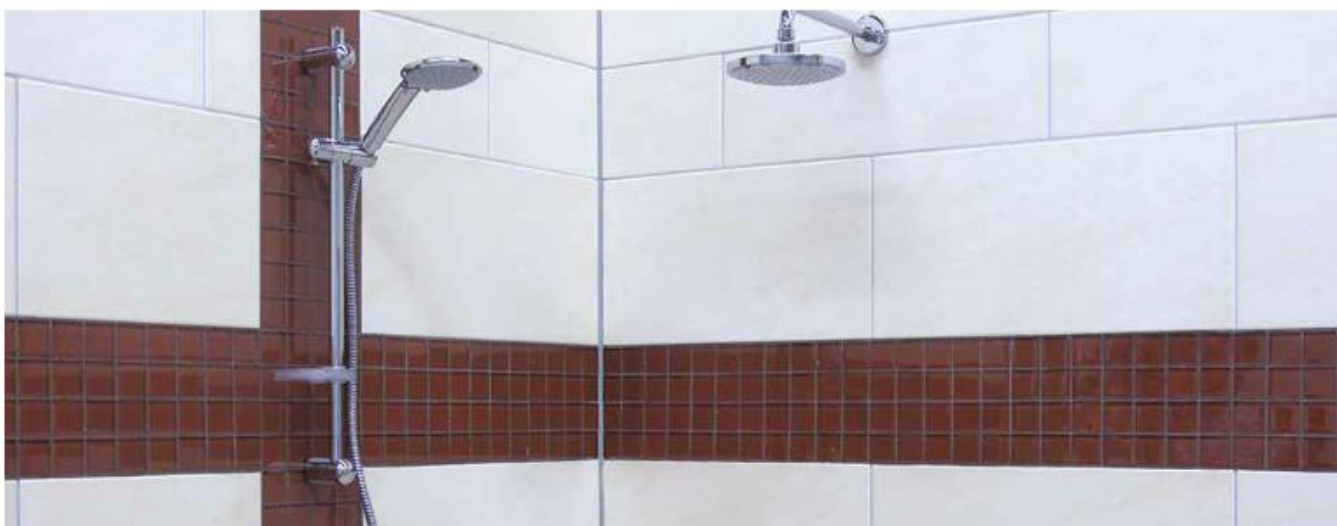
11 Облицовка ванной комнаты, затёртая Sopro DF 10®.